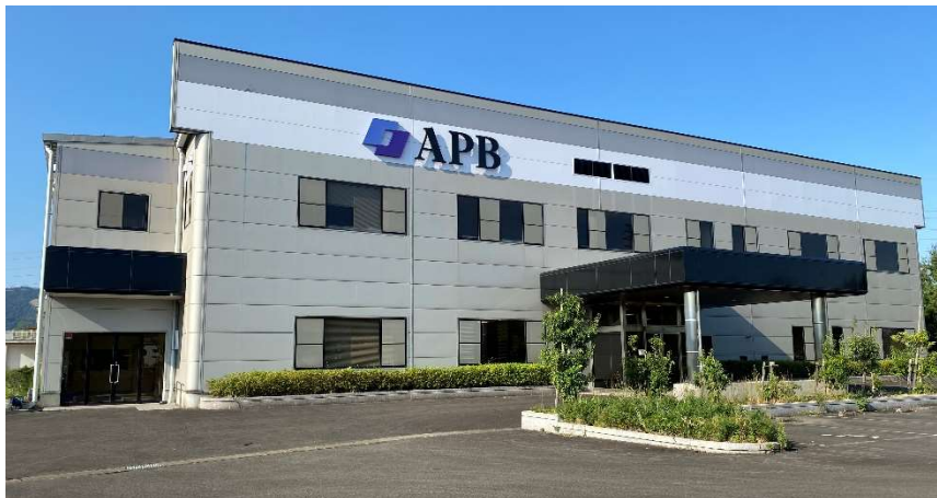
APB 福井センター武生工場外観