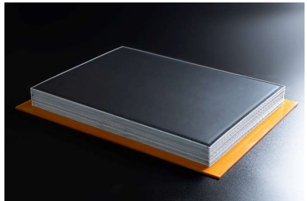
内部構造 (左写真モジュール内部) 40枚の電池セルをバイポーラ積層し直列に接続